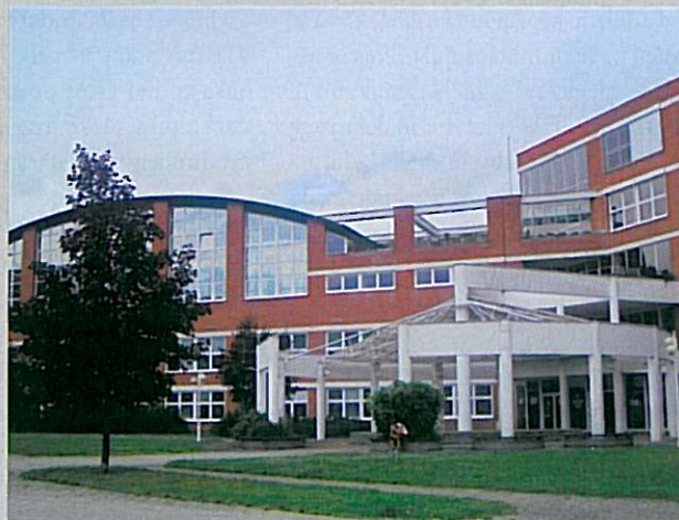
Budova školy.

pro odborné učitelky, které jím mohou pro svou profesi získat větší důstojnost. Ony musí vymyslet vzdělávací programy certifikovaných kursů, musí je připravit k akreditaci, což je složitý byrokratický proces, a musí v nich učit. Musí zajistit spoustu dalších náročných logistických operací, a to jim dodává sebevědomí a prestiž. Učitelky nebyly zvyklé na tento typ aktivity. Díky zkušenostem, které jsem získala v oblasti celoživotního vzdělávání v Ústřední vojenské nemocnici v Praze, jsem ale byla schopná jim pomoci a metodicky je vést.