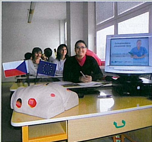
Účastnice kursu Ošetřování chronických ran.