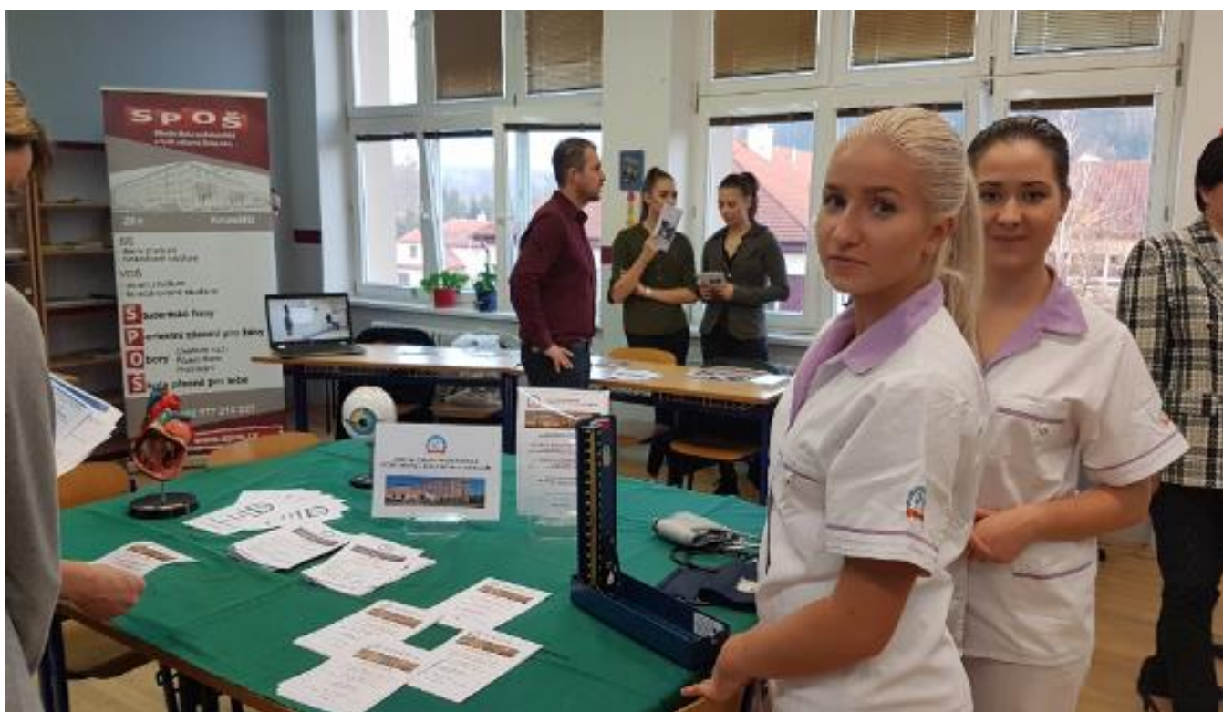
Prezentace školy v ZŠ Napajedla