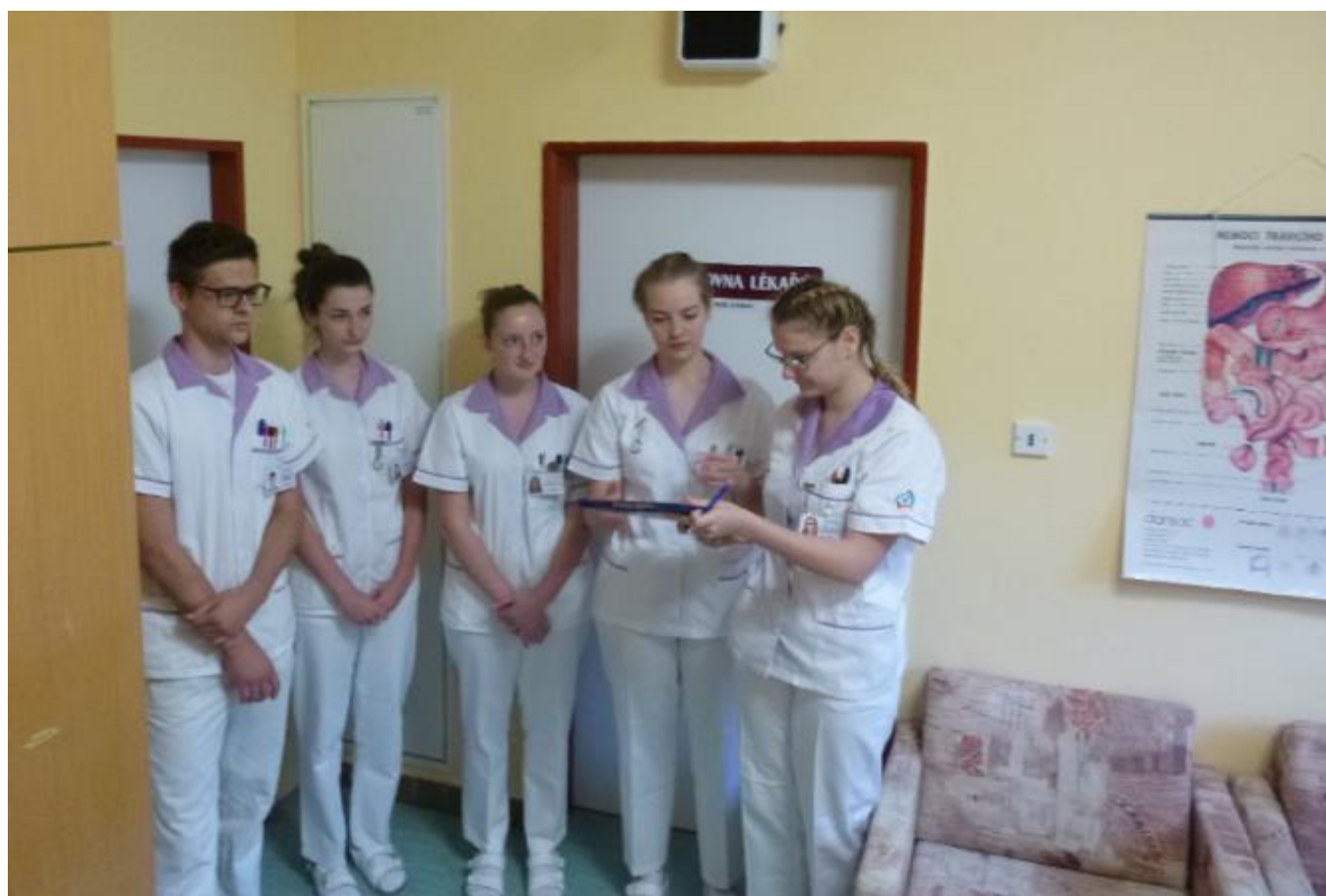
Praktická maturitní zkouška