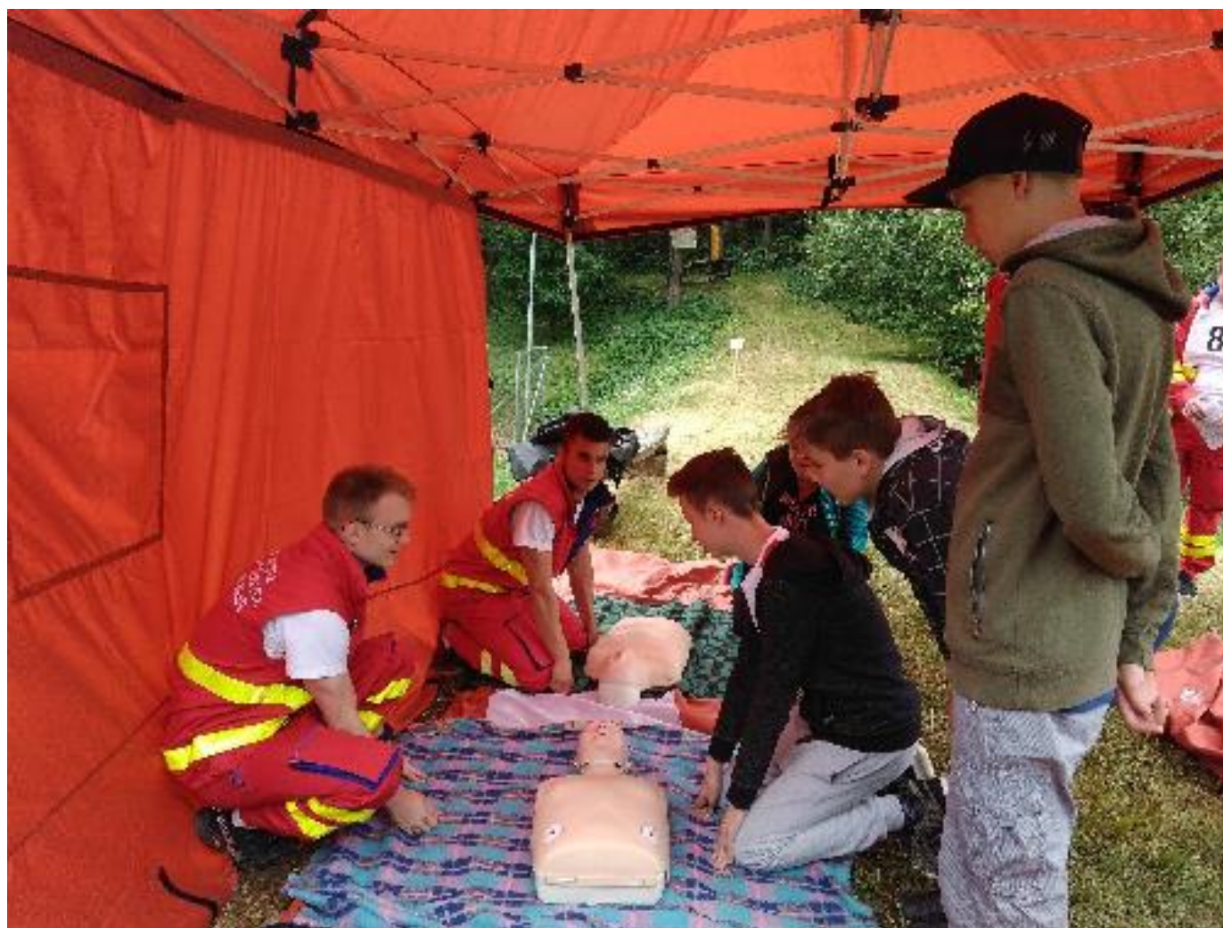
Den IZS Popovice

* možnost volit mezi jazyky ** označeny předměty absolutoria