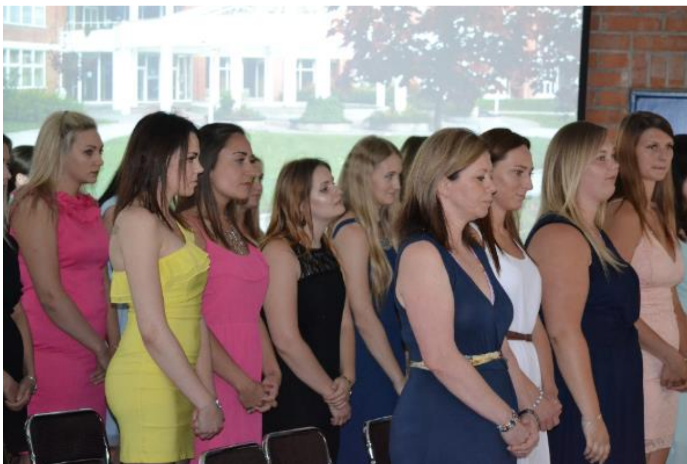
Slavnostní vyřazení DVS