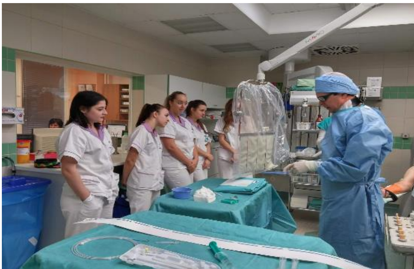
Exkurze v Kardiologickém centru