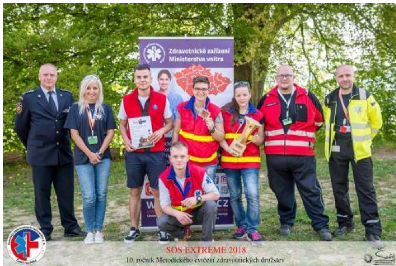
Soutěž záchranářů SOS Extreme 2018

Pro žáky střední školy tiskneme dodatky k osvědčení přes webové rozhraní z edo.europass.cz . Tyto dokumenty obsahují přehled kompetencí pro absolventy jednotlivých oborů a nejsou individualizovány. Žáci střední školy získávají při studiu oboru vzdělávání Zdravotnický asistent maturitní vysvědčení, oboru Ošetřovatel vysvědčení o závěrečné zkoušce a výuční list. Studenti vyšší odborné školy získávají vysvědčení o absolutoriu a diplom. Úspěšným absolventům jsou tyto dokumenty včetně Europassů předávány na slavnostním vyřazení v aule školy.