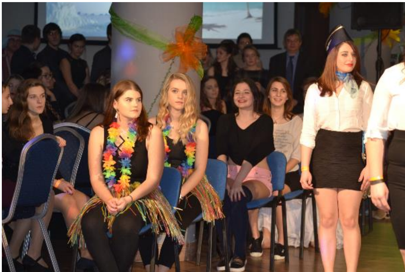
Reprezentační ples školy