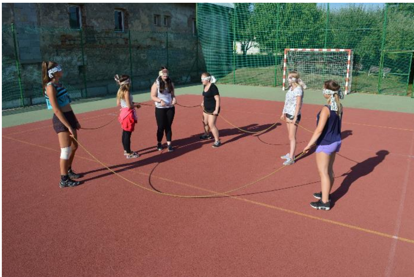
Adaptační pobyt 1.0

Jednou z podmínek přijetí všech uchazečů ke studiu na SZŠ i VOŠZ byl dobrý zdravotní stav.