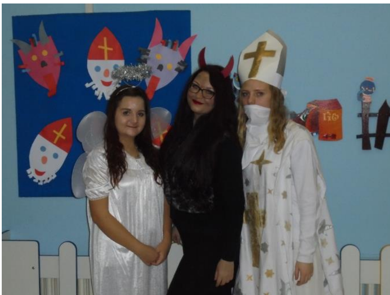
Mikuláš v jeslích Budovatelská