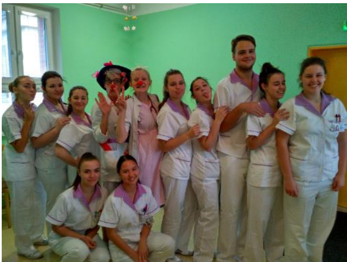
Klauni v KNTB