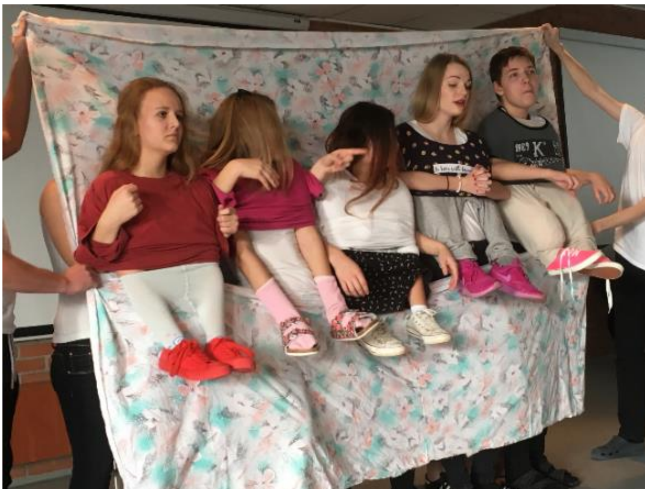
Pasování 1. ročníků