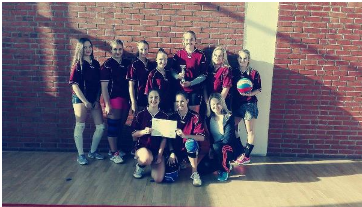
Okresní kolo ve volejbalu dívek