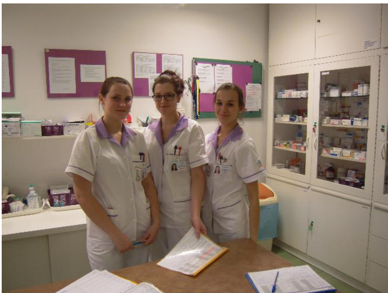
Praktické vyučování a odborná praxe

Jednou z podmínek přijetí všech uchazečů ke studiu na SZŠ i VOŠZ byl dobrý zdravotní stav.