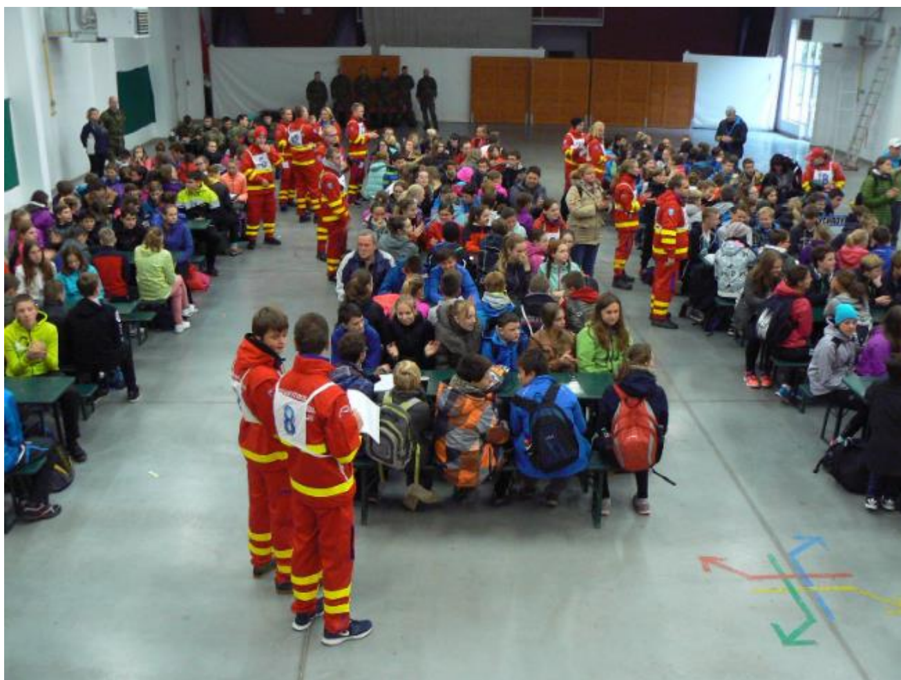
Soutěžní den IZS, Amfik Bukovina