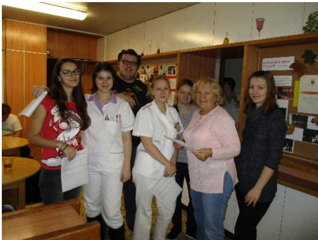
Registr dárčů kostní dřevě