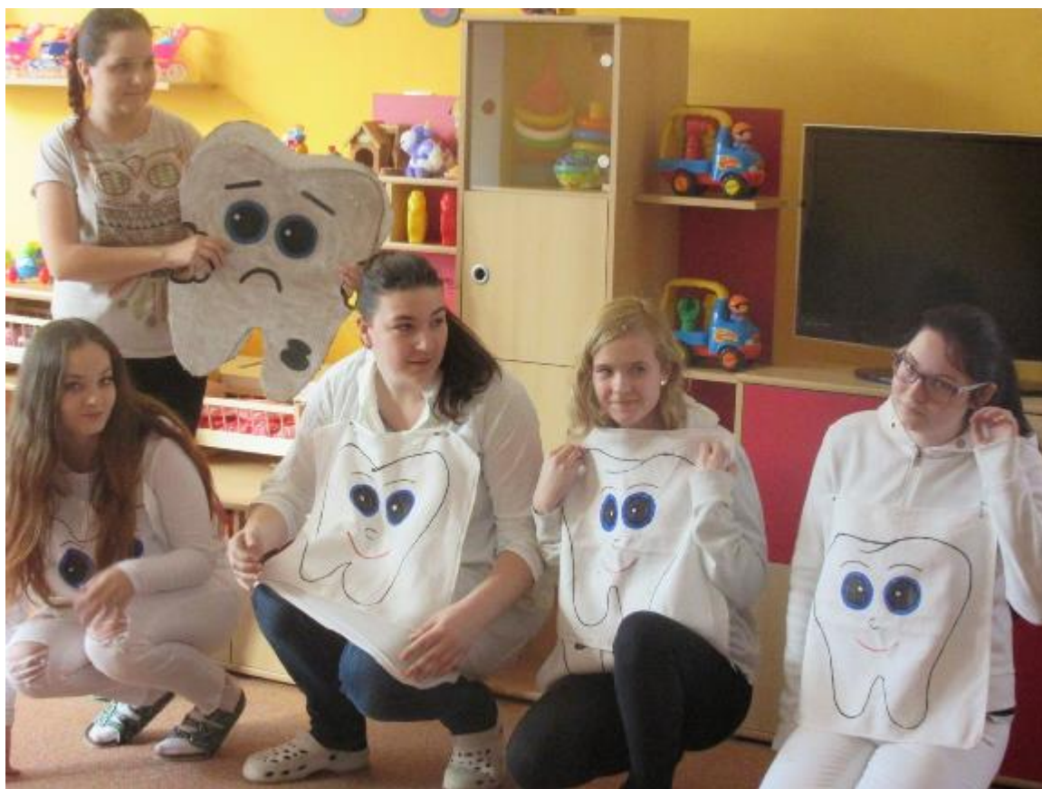
Prezentace péče o zoubky v jeslích