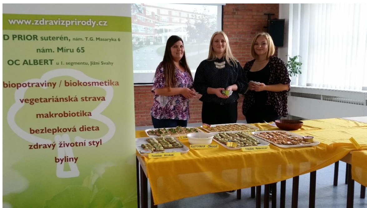
Týden zdraví – ochutnávka zdravých jídel