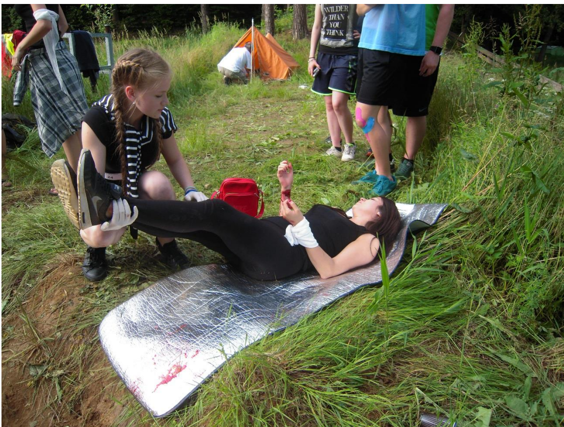
Soutěž v první pomoci Jihlava