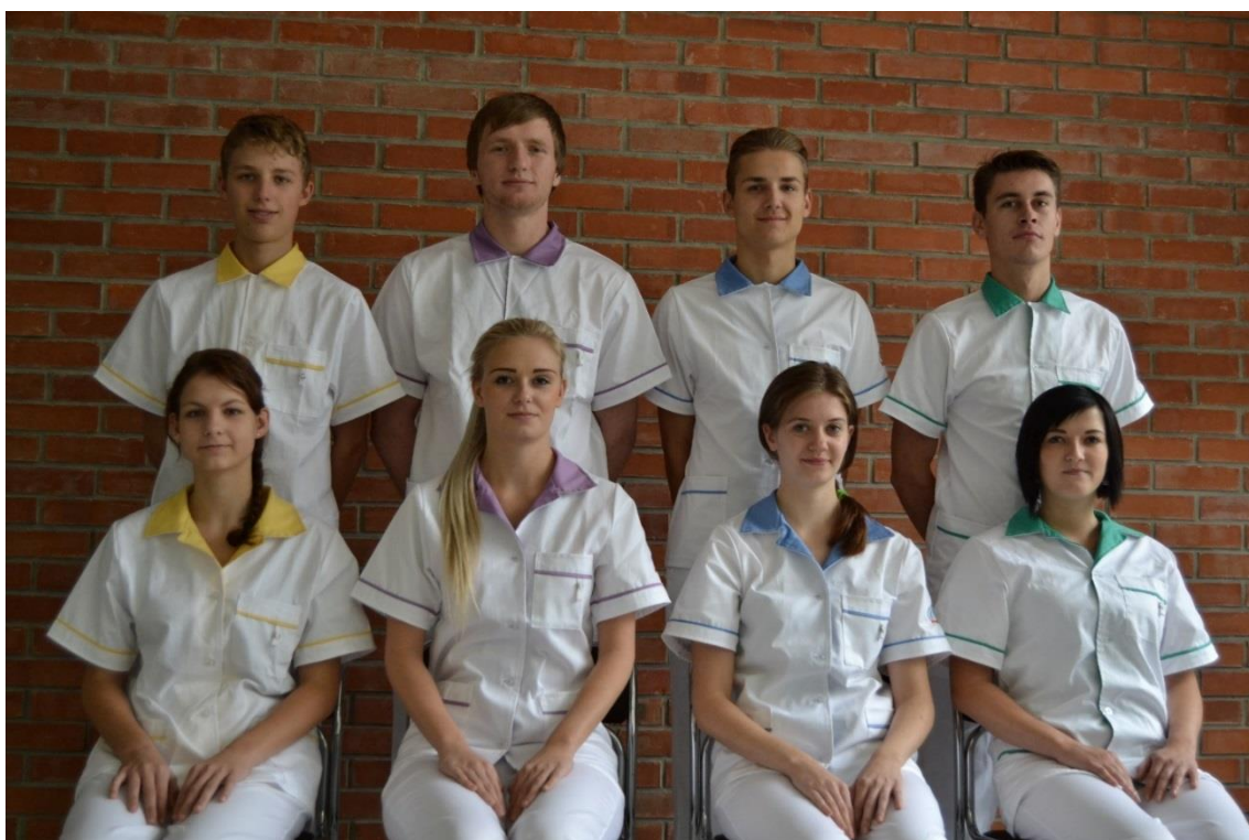
Nové uniformy žáků a studentů na praxi

* možnost volit mezi jazyky ** označeny předměty absolutoria