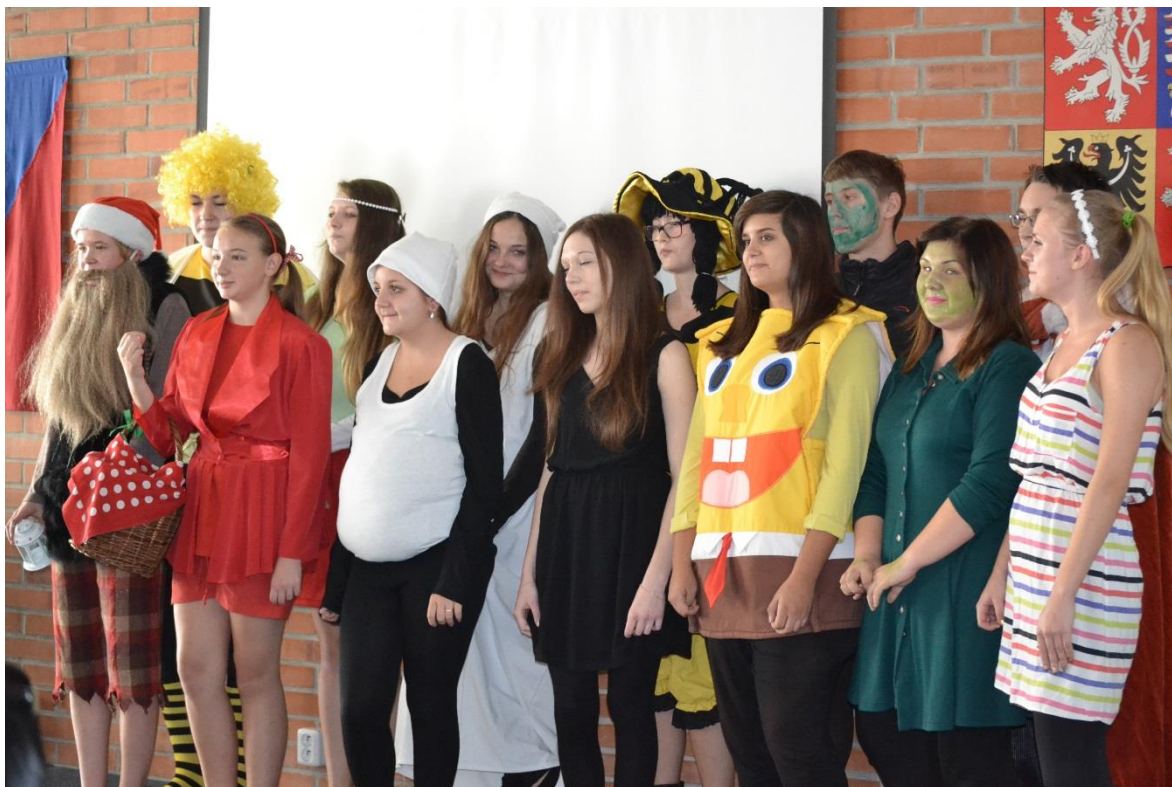
Pasování žáků 1. ročníků