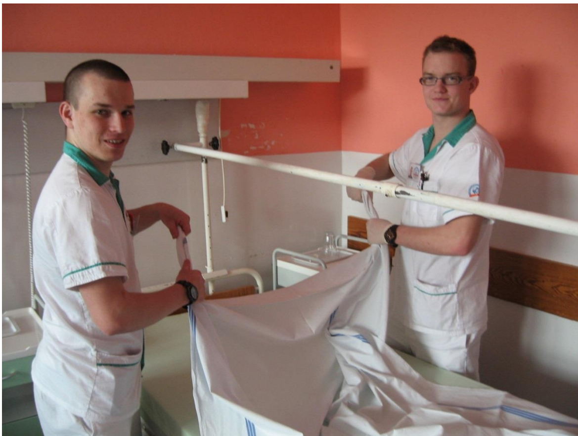
Studenti DZZ na odborné praxi