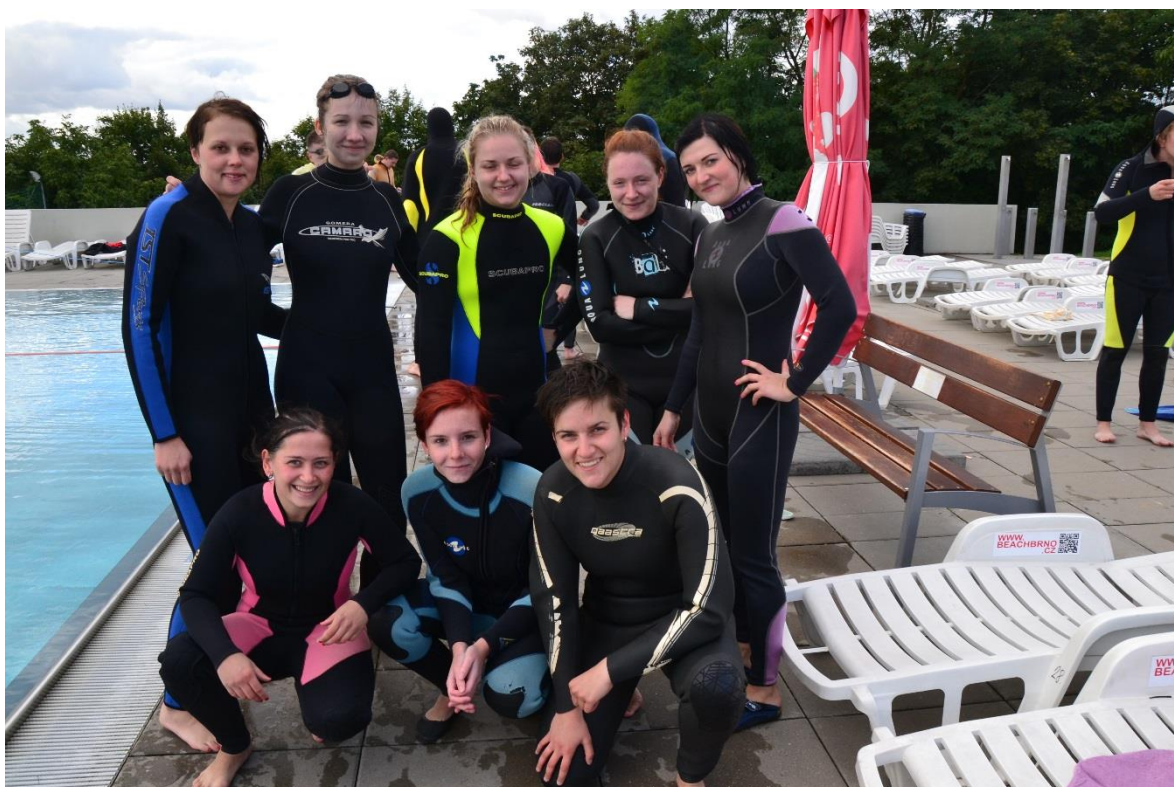
Kurz vodní záchranné služby