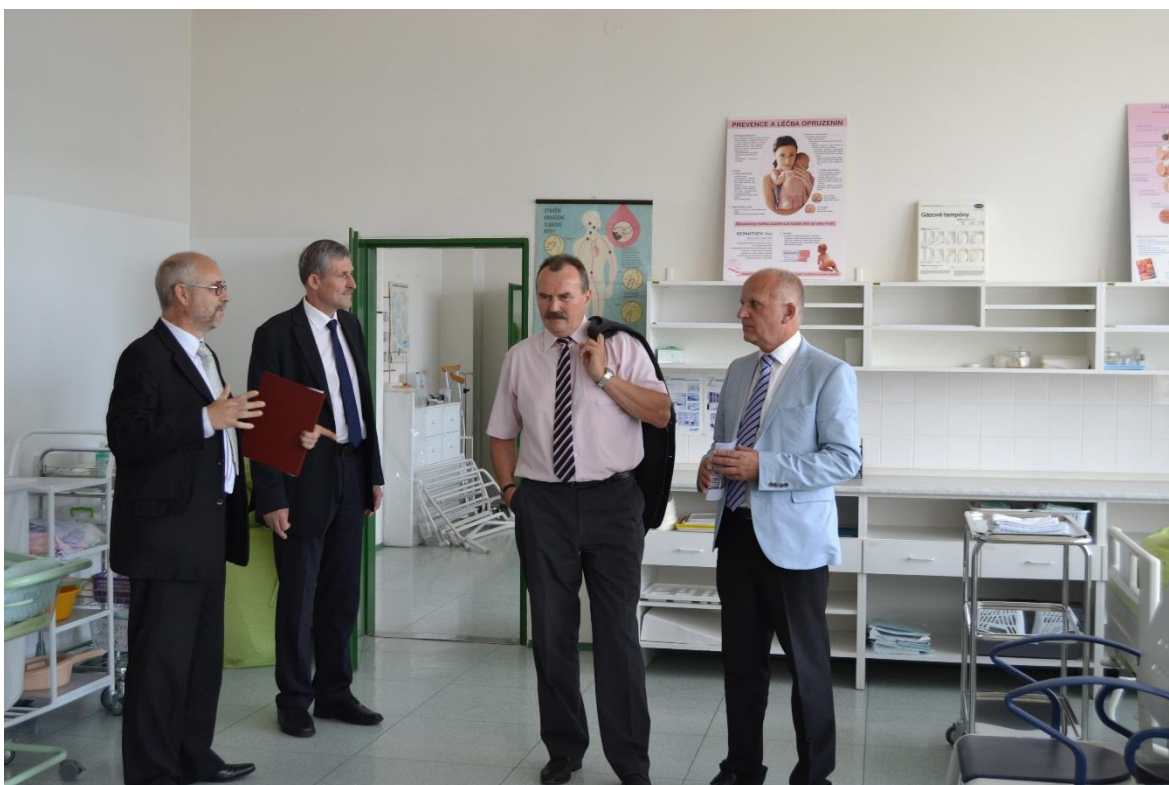
Oslava 20. výročí budovy školy