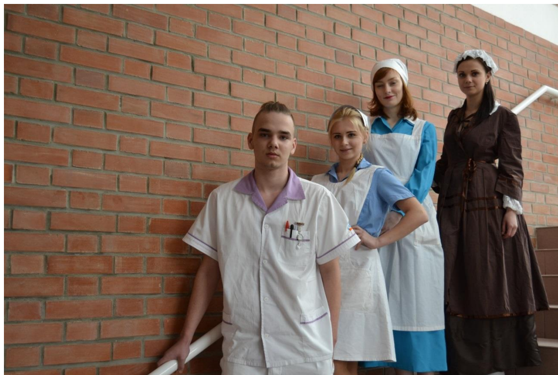
Žáci 4.B v dobových uniformách

Podmínkou přijetí všech uchazečů ke studiu na SZŠ i VOŠZ byl dobrý zdravotní stav.