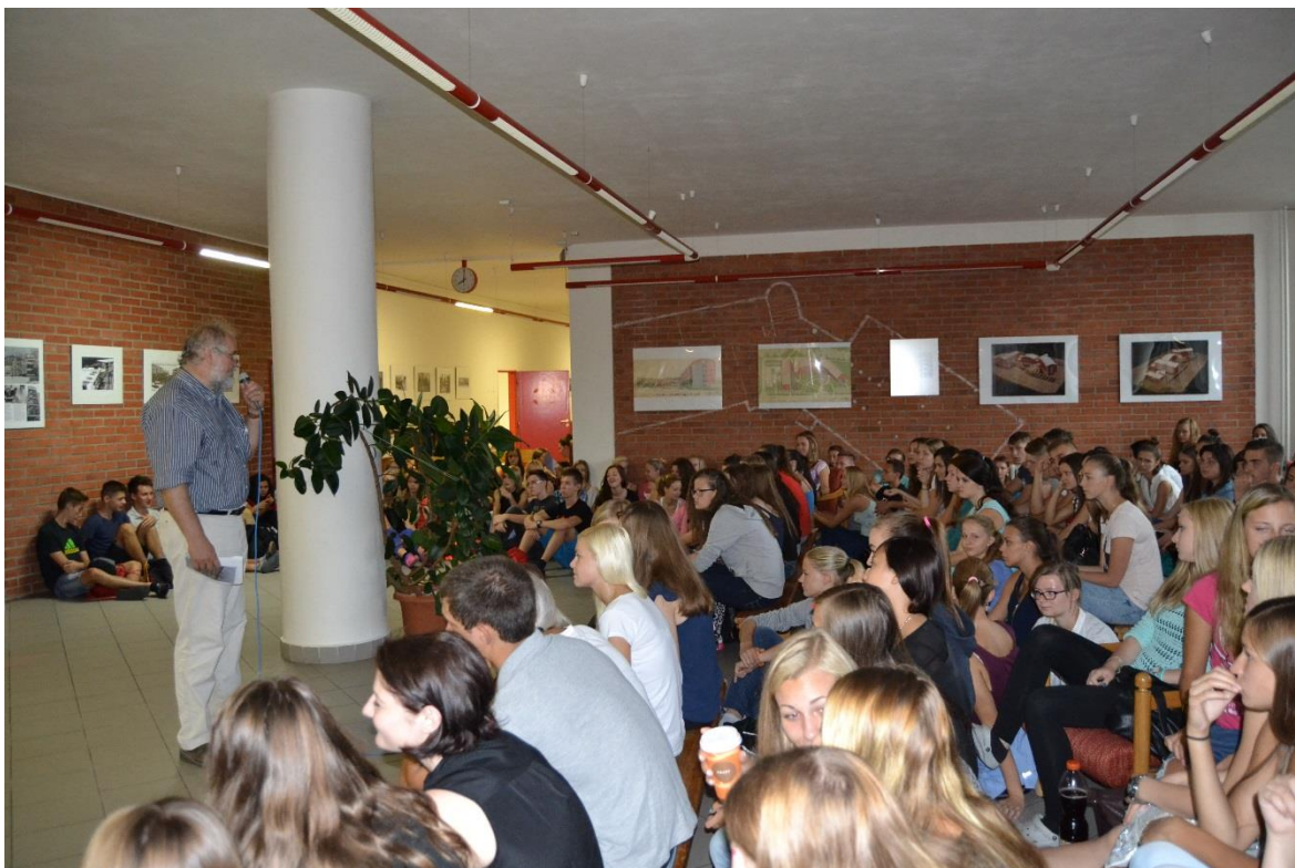
Vernisáž výstavy k 20. výročí budovy školy