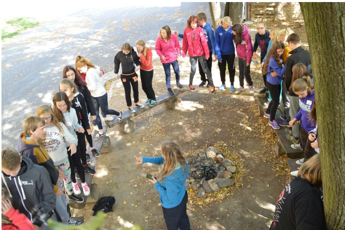
DIS Fryšták 1. ročníky