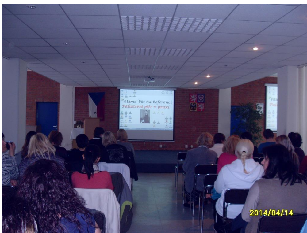
Konference Paliativní péče v praxi