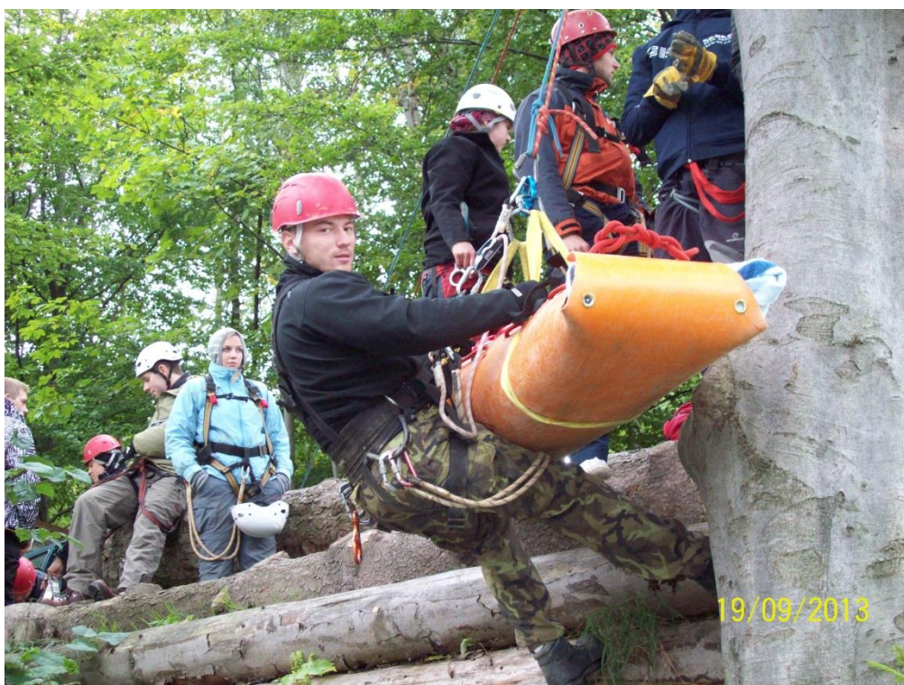
Studenti oboru vzdělání DZZ 3. na Kurzu horské záchranné služby v Jeseníku