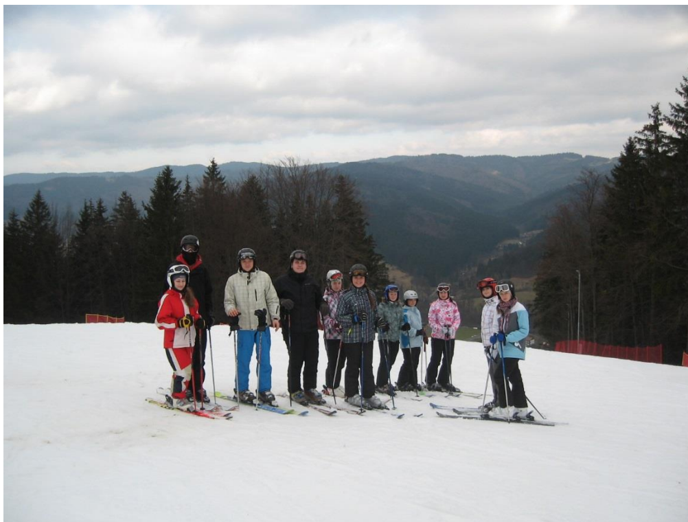
Žáci 1. ročníků SZŠ na Lyžařském kurzu