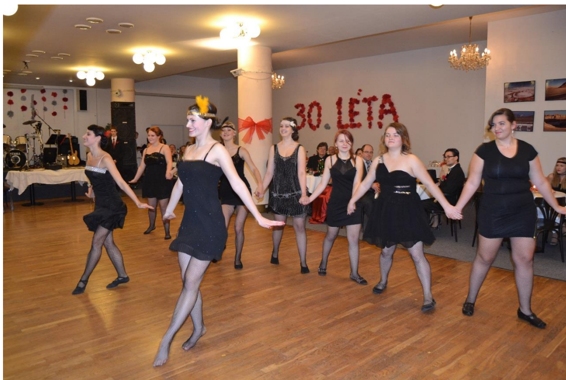
Školní ples 2014 – vystoupení žákyň

V hlavním sále zahrála skupina Aventis, která si hned na počátku zajistila plný taneční parket. V taneční kavárně v letošním roce probíhala diskotéka, kterou měla ve svých rukou DJ Hannah Vee.