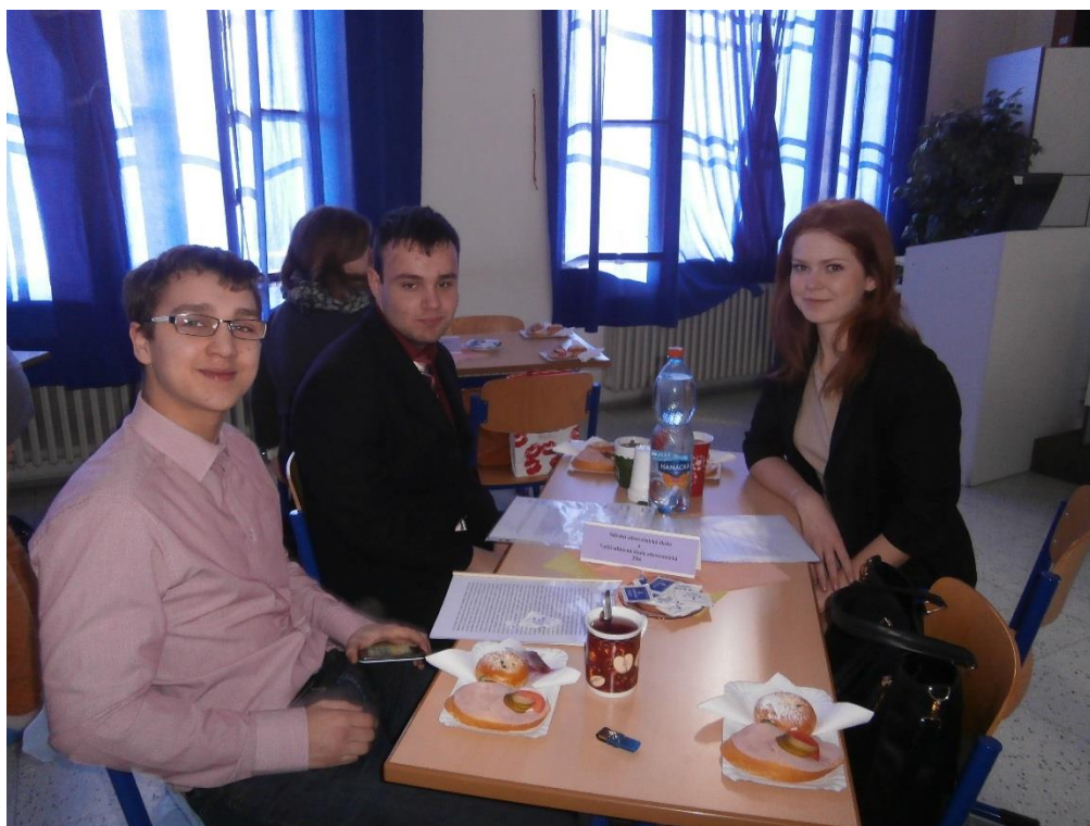
Soutěž v Psychologii a komunikaci – regionální kolo

Podmínkou přijetí všech uchazečů ke studiu na SZŠ i VOŠZ byl dobrý zdravotní stav.