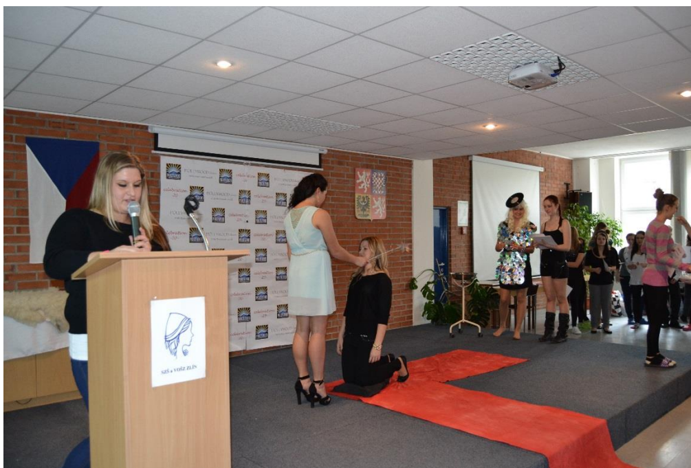
Pasování žáků 1. ročníků