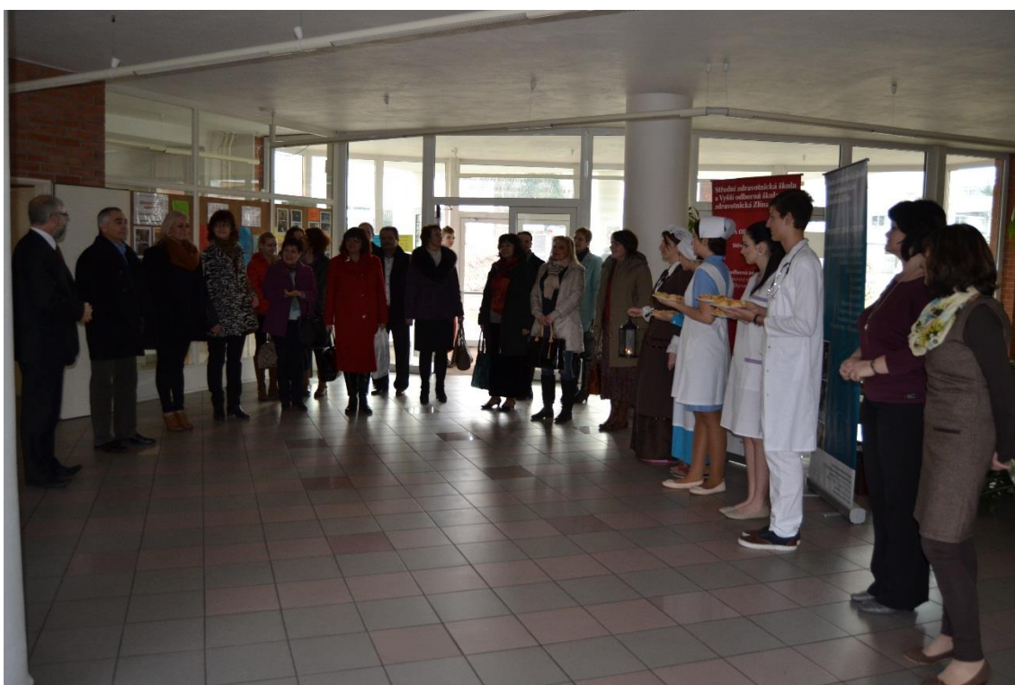
Návštěva ředitelů zdravotnických škol ze Slovenska