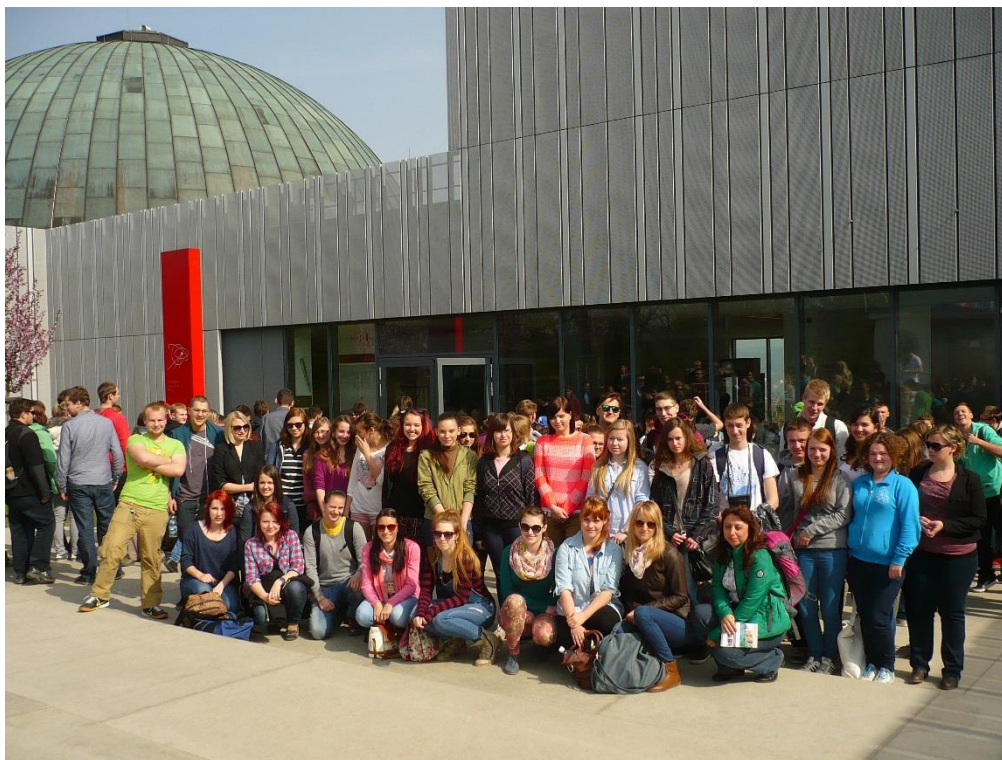
Žáci 3. ročníků SZŠ na exkurzi Univerzitního kampusu a planetária v Brně