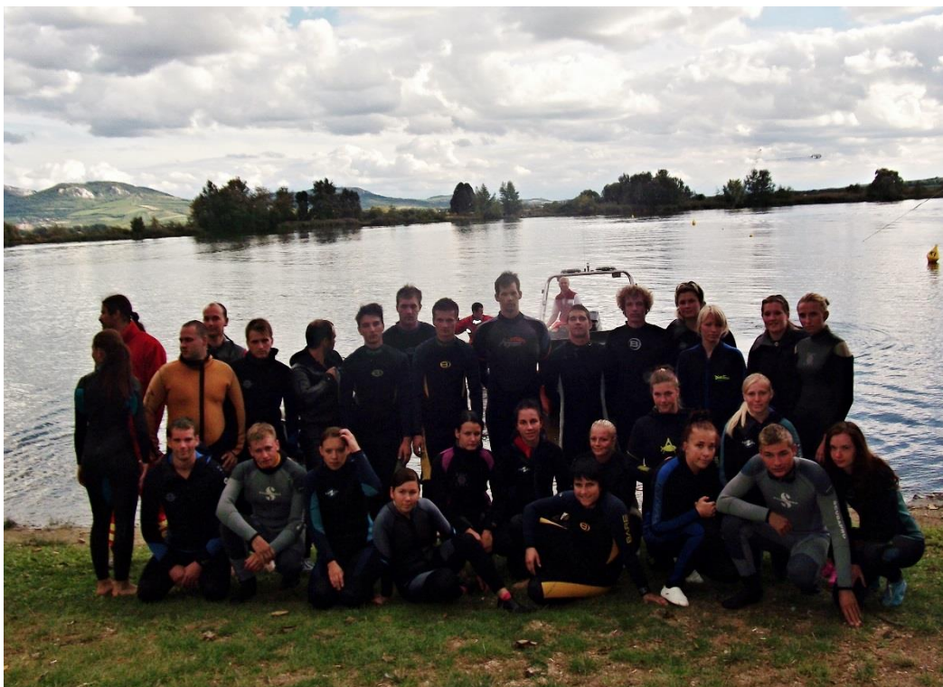
Studenti oboru vzdělání DZZ 2. na Kurzu vodní záchranné služby na Pálavě