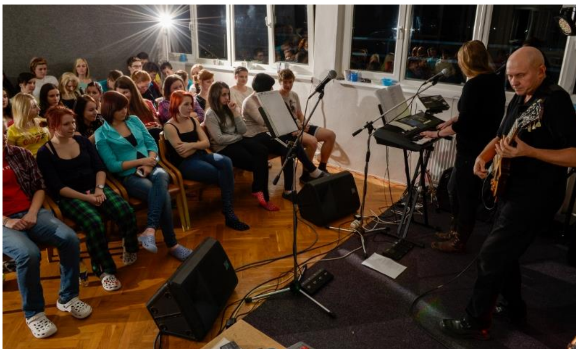
Koncert pro studenty na Domově mládeže

V rámci filmového festivalu jsme zhlédli doprovodný program na Náměstí Míru.