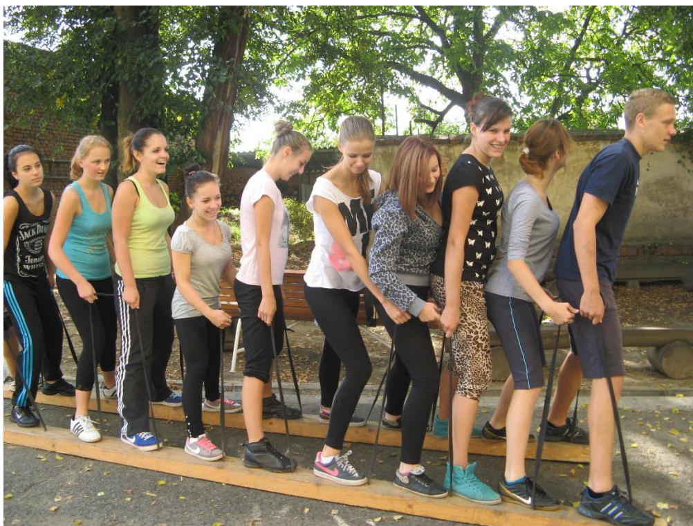
Žáci oboru vzdělání ZA 1. ročníků na adaptačním pobytu ve Fryštáku