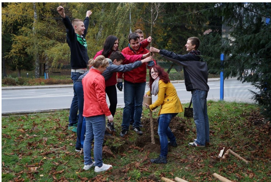
Studenti SZŠ a VOŠZ při Sazení stromků