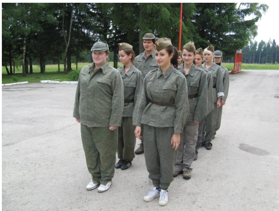
Letní sportovní kurz 2. ročníků