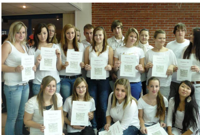
Pasování studentů 1. ročníků