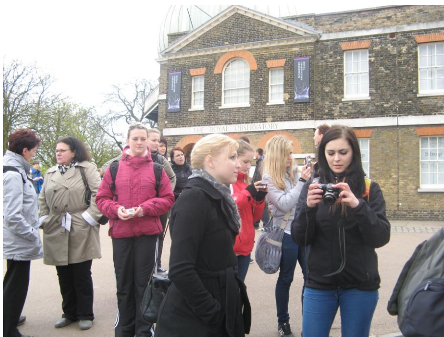
Poznávací zájezd do Londýna