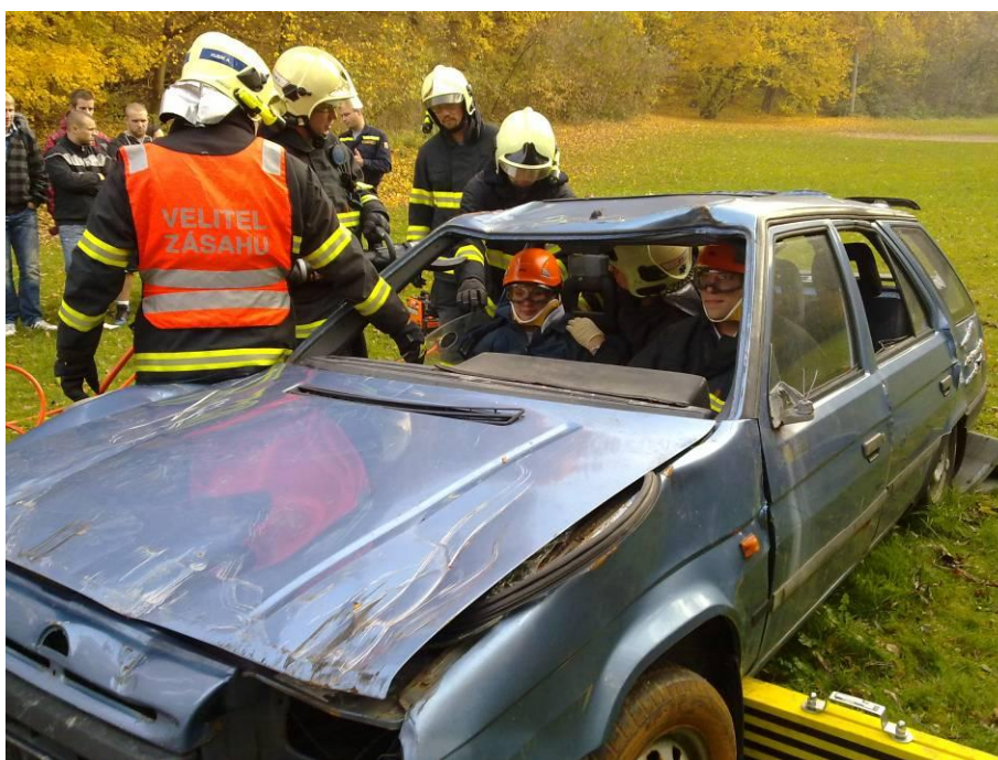
Seminář HZS Zlín – vyproštění osob z havarovaných vozidel