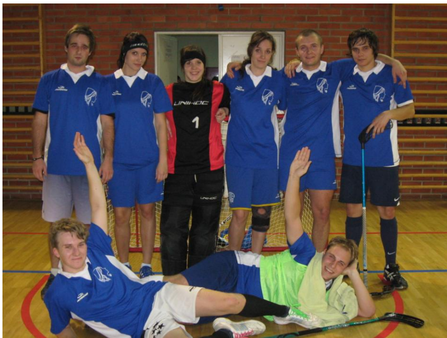
Turnaj ve florbale v naší tělocvičně