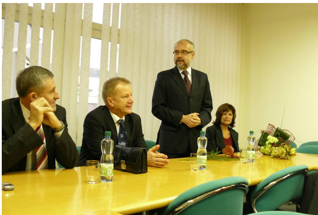
Slavnostní uvedení ředitele školy do funkce k 15. 12. 2011