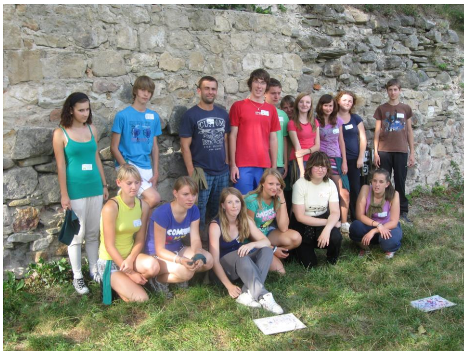
Adaptační pobyt v DIS Fryšták pro žáky 1. ročníků