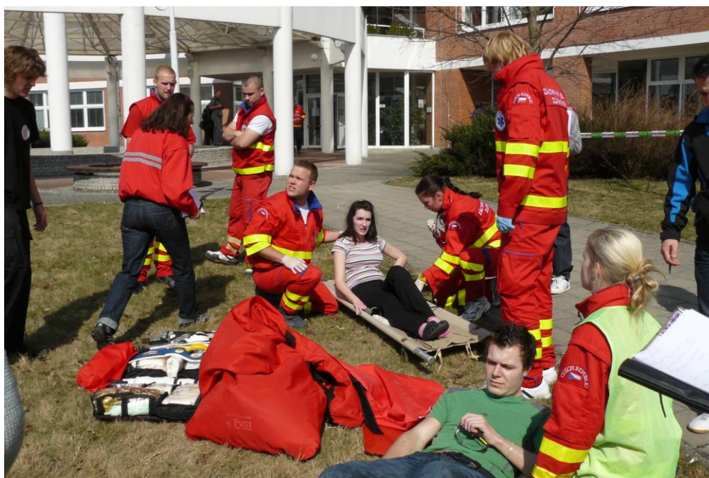
Cvičení – Krizová situace ve škole