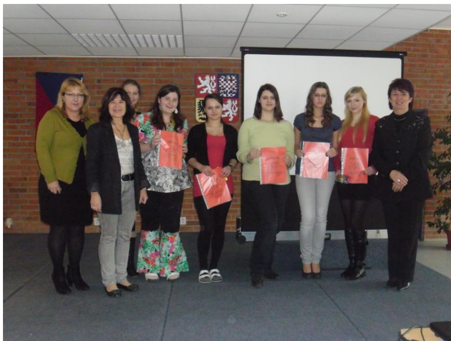
Soutěž v psychologii