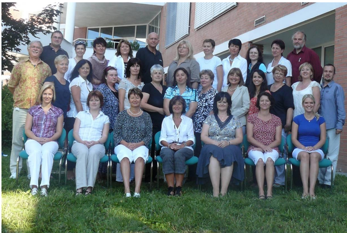
Pedagogický sbor – 1. 9. 2011