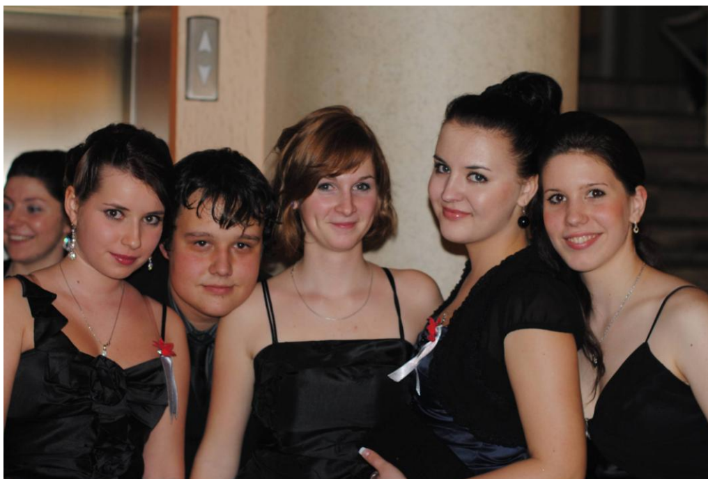
Reprezentační ples 2012