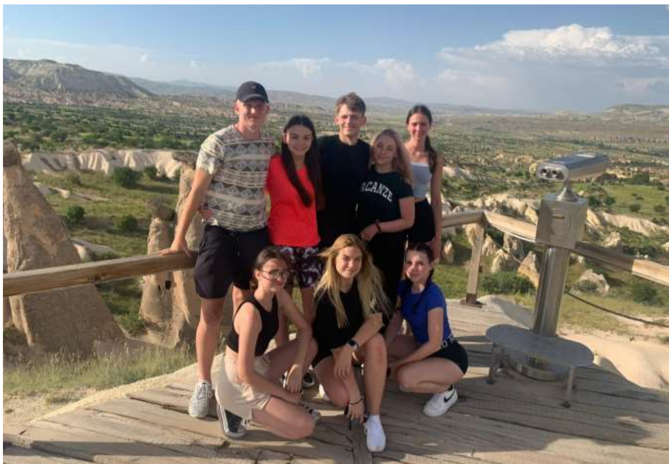
Žáci v Turecku – Erasmus+

Žáci při výuce používali aplikace Mentimeter, Padlet, Learningapps, Wordwall, Kahoot, ale také třeba aplikaci Záchranka k výuce první pomoci. Ukázalo se, že žáci jsou zvyklí používat mobilní telefony k uváděným výukovým aktivitám.