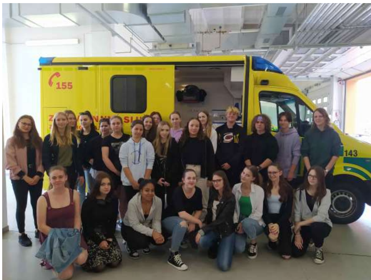
1.C na exkurzi ZZS Zlín