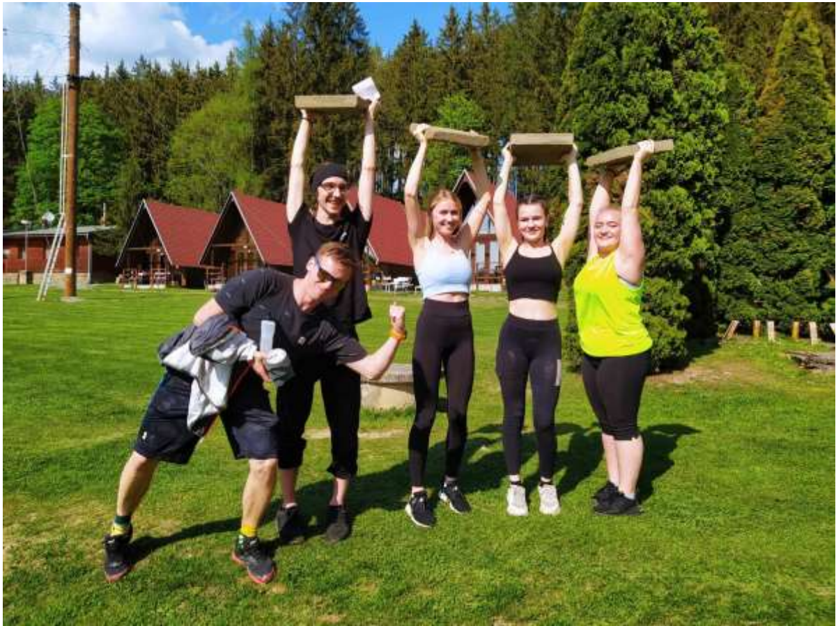
2. ročníky na sportovním kurzu Baldovec