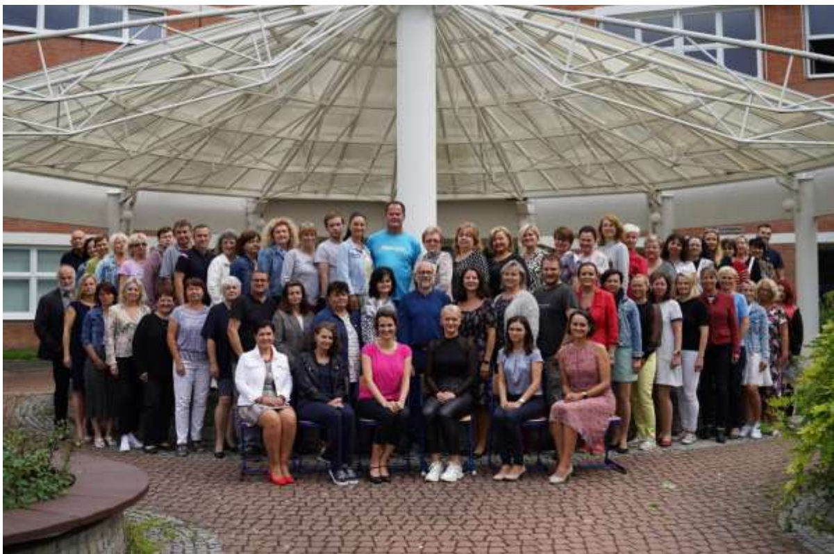
Zaměstnanci školy v září 2021