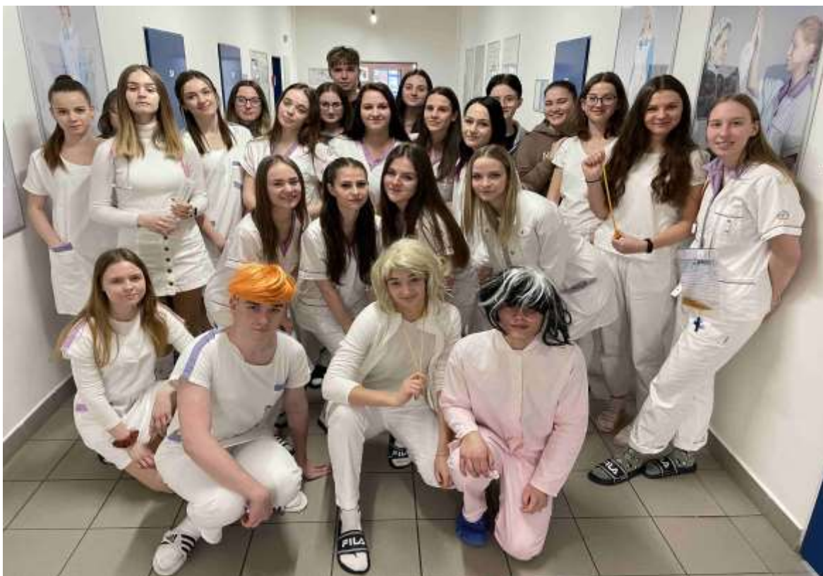
Pasování 1. ročníků SZŠ