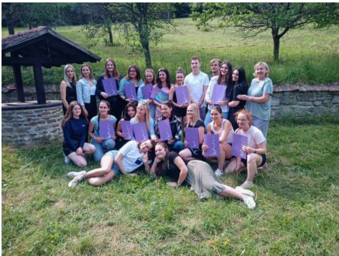
4.C po maturitních zkouškách