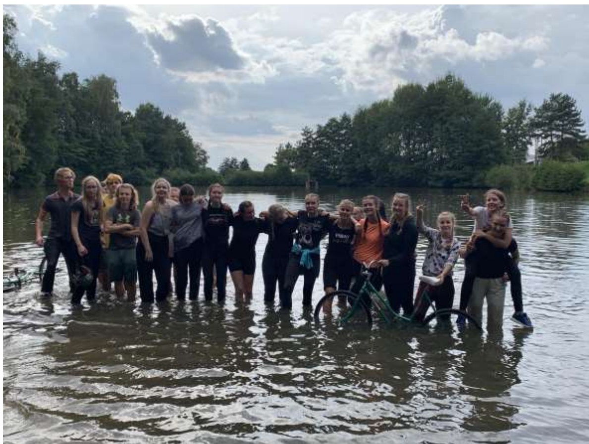
1.B na adaptačním pobytu DIS Fryšták