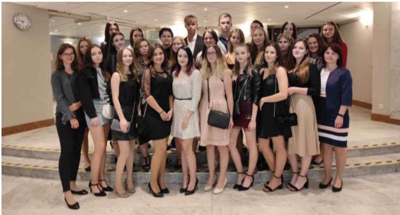
4.A na kulturně poznávacím zájezdu v Praze – návštěva divadla

Škola na základě spolupráce se společností Alive zřídila středisko pro žadatele Isic karet z řad žáků, studentů i pracovníků školy. Kromě slevových výhod karty plní funkci studijních průkazů a používají se do všech elektronických systémů školy vč. vstupního, stravovacího a kopírovacího.